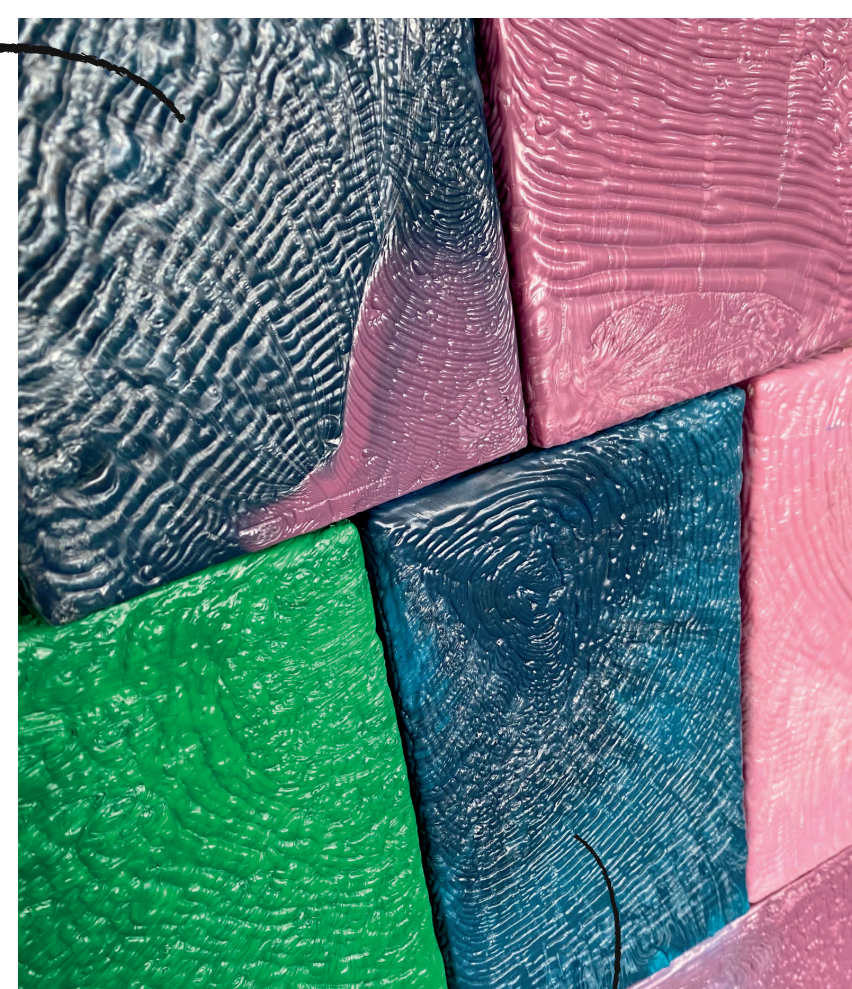
plastica riciclata 02

Il gioco del costruire oltre a favorire lo sviluppo di competenze motorie come la coordinazione del movimento, stimola la creatività e produce soddisfazione nel vedere realizzata la propria idea. Trovare l'incastro tra i mattoncini favorisce l'autocorrezione uno dei caratteri fondamentali del principio montessoriano.