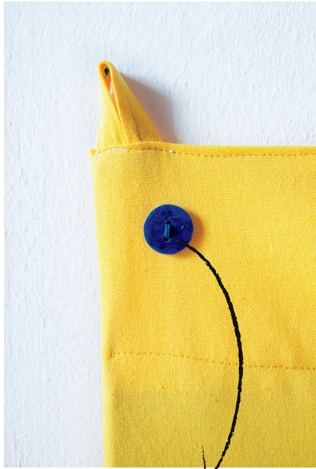
bottoni blu, plastica riciclata 05